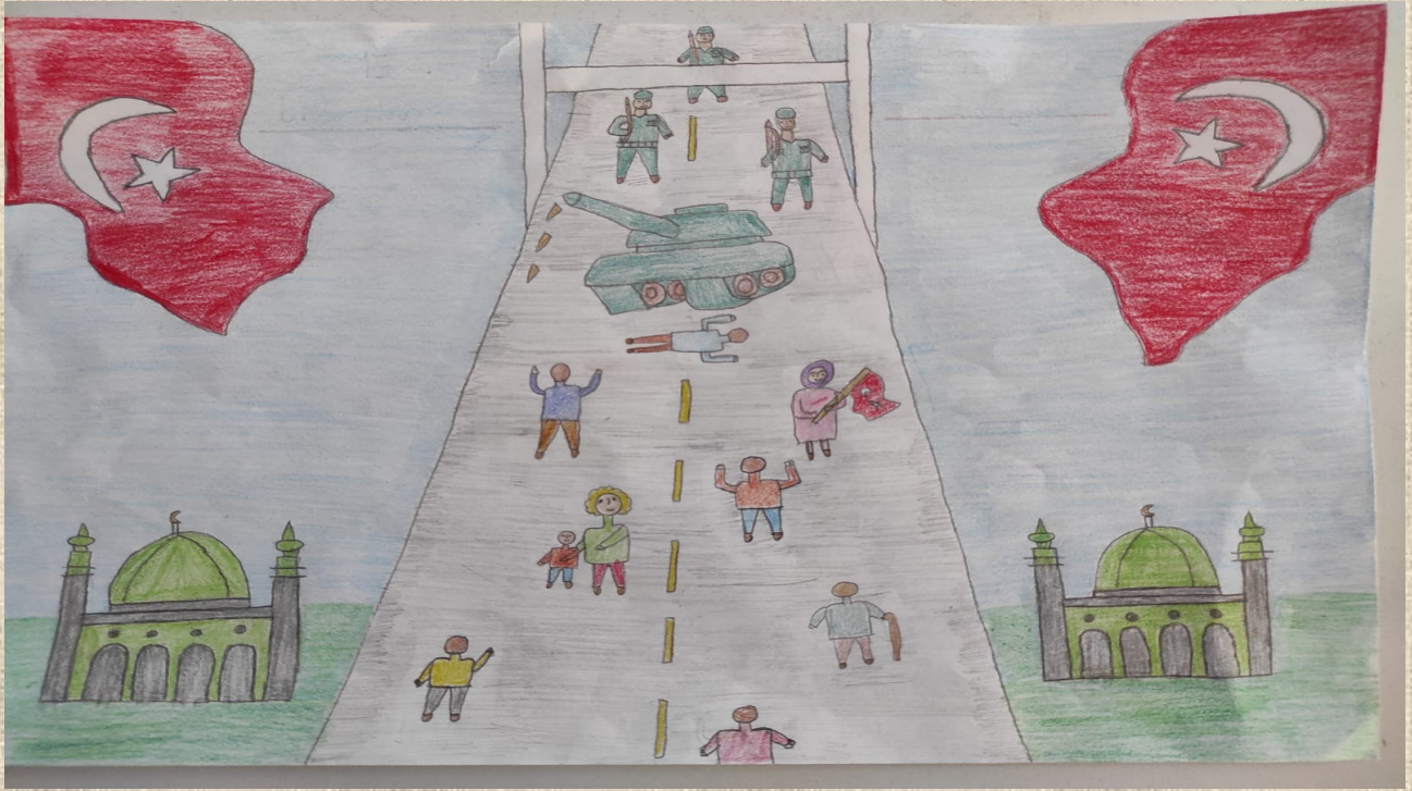
Yazel TAŞKIN 4/B Sınıfı Öğrencisi