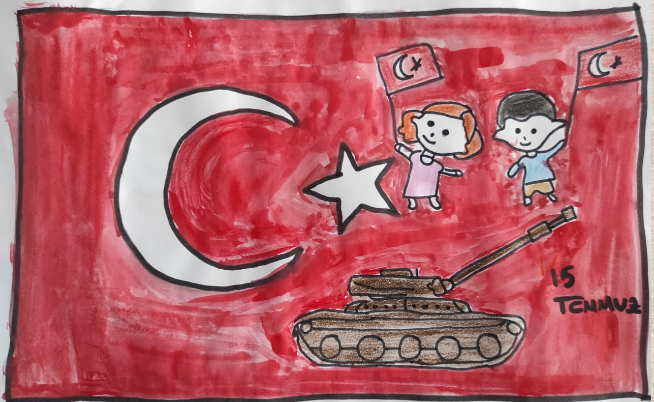
Şeyma SELÇUK 2/B Sınıfı Öğrencisi