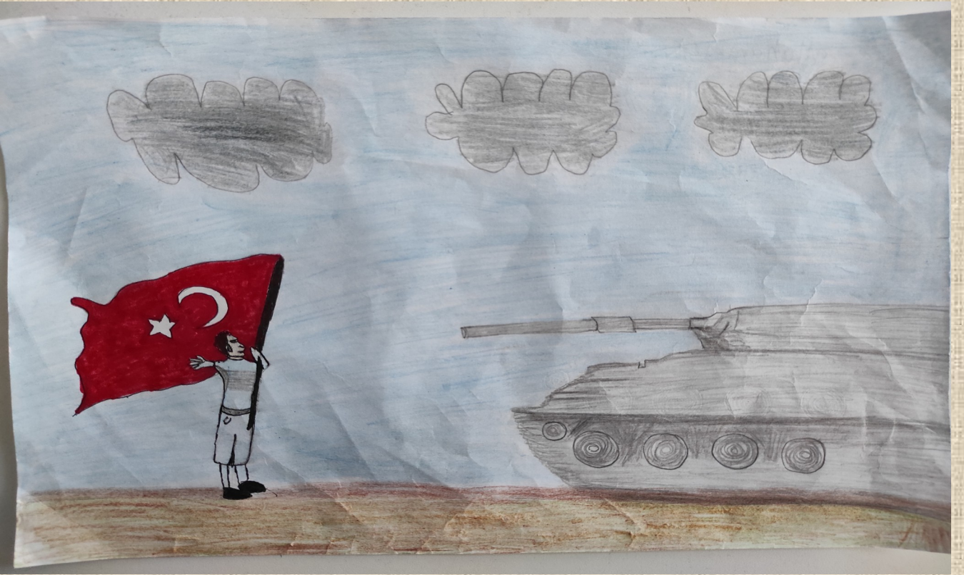
Muhammet YILMAZ 4/B Sınıfı Öğrencisi