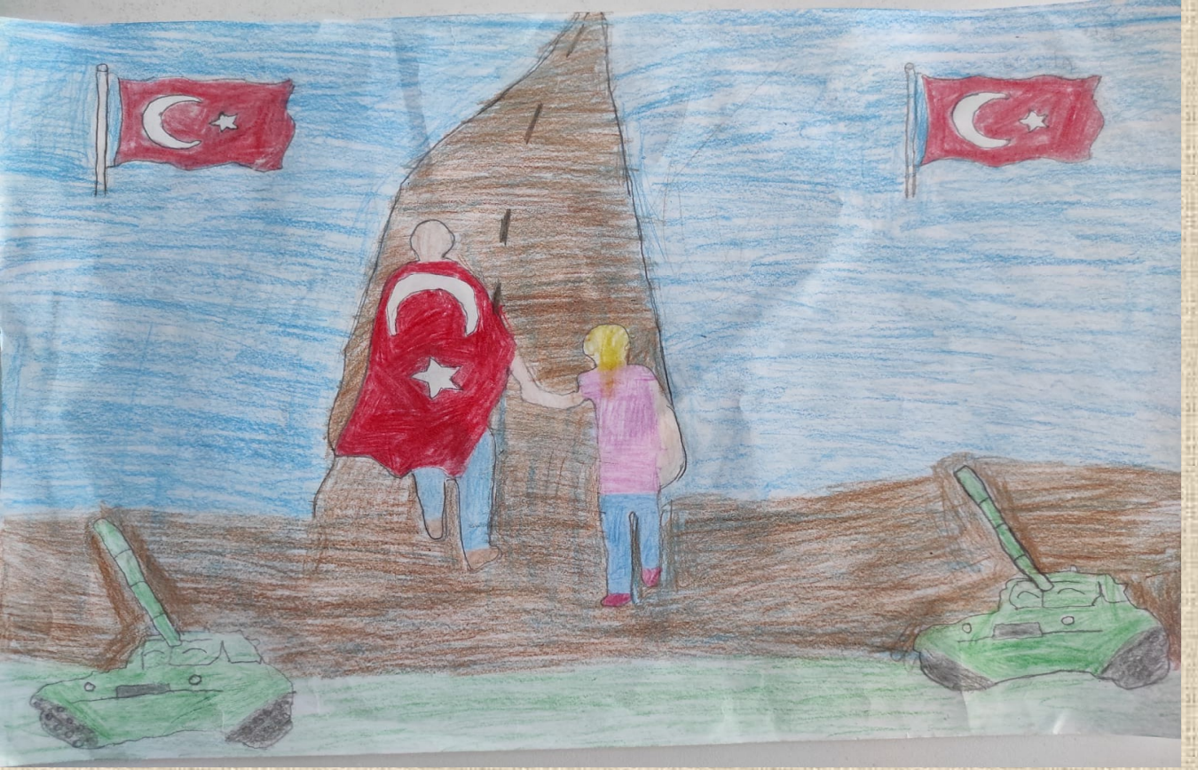
Ebrar ALAK 4/B Sınıfı Öğrencisi